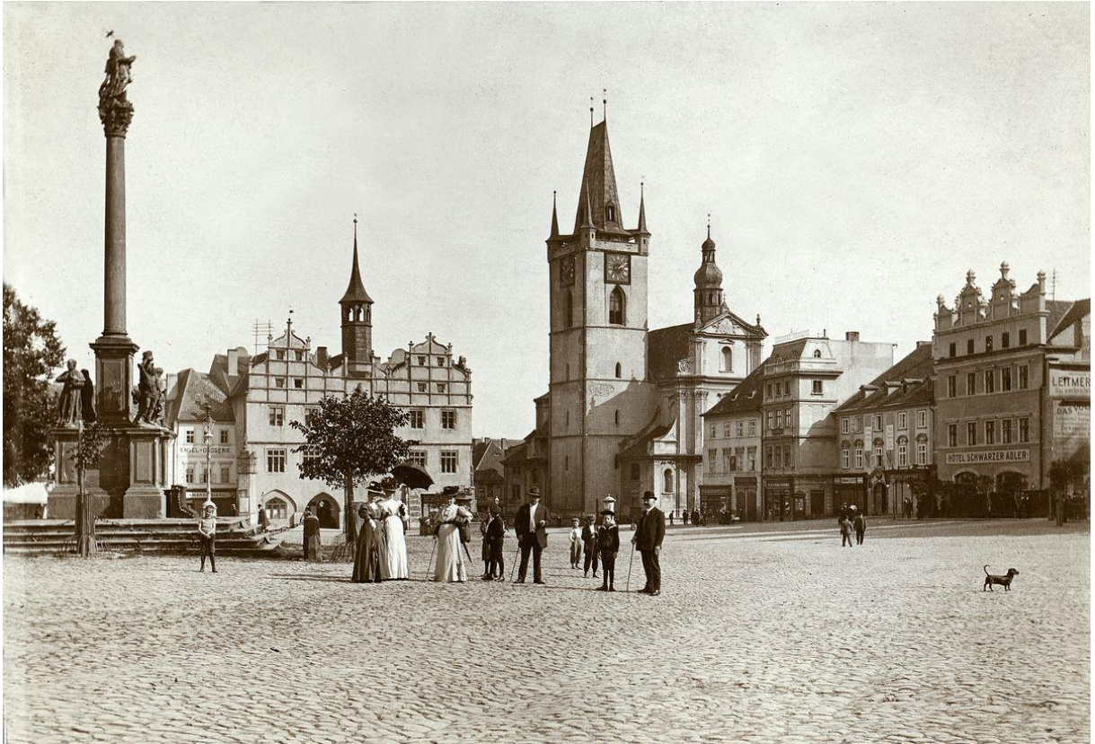
Historický kout na Mírovém náměstí, kolem roku 1908.

V pozadí fotografované skupiny vidíme morový sloup z roku 1863, starou radnici (s poměrně čerstvě zazděným podloubím), kostel Věch svatých s městskou věží i dům U Černého orla (Hotel Schwarzer Adler), na kterém nenajdeme jeho typická sgrafita (ty byly odkryty až při rekonstrukci v roce 1957).