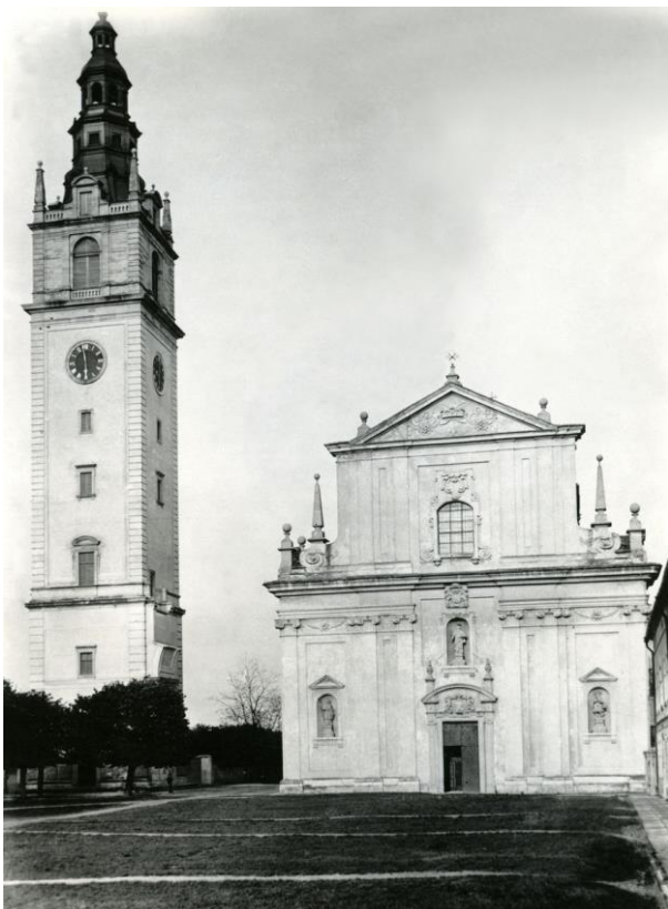
Katedrála sv. Štěpána s již dostavěnou věží, po roce 1890. Věž není ještě propojena spojovacím obloukem s katedrálou. Raně barokní katedrála sv. Štěpána byla vystavěna v letech 1663 – 1670. Věž u katedrály vznikla později (v letech 1883-1889), dnes funguje jako vyhlídka.