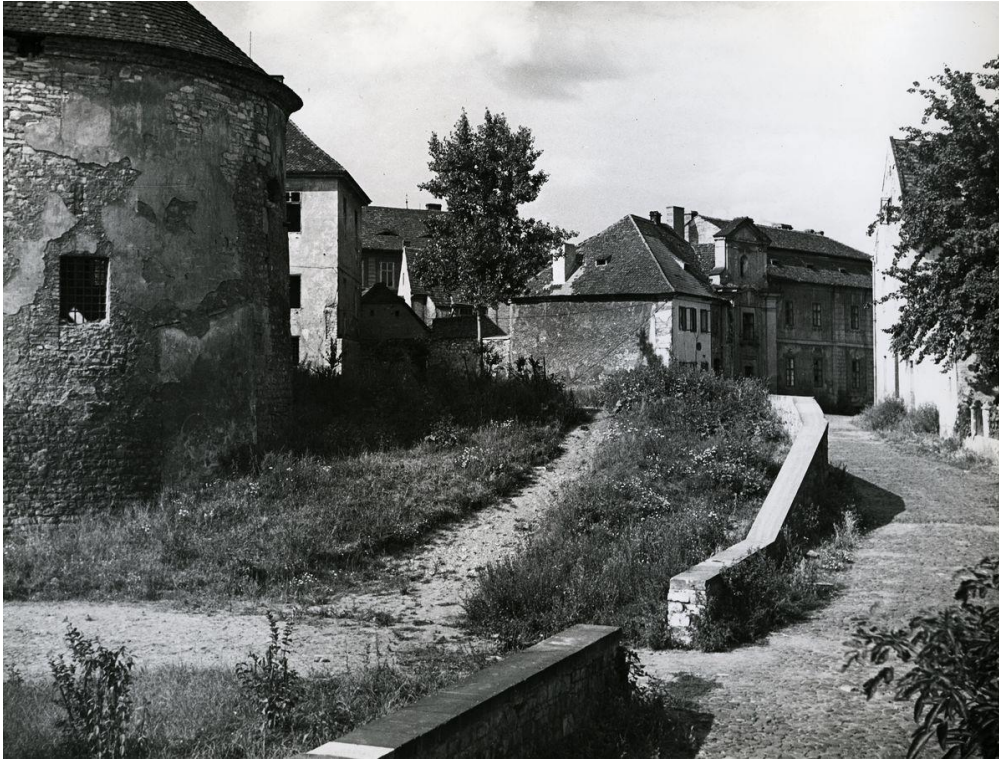
Malá Mlýnská ulice, 1957. Bašta na pravé straně fotografie sloužila nedaleké věznici v 19. století jako věžeňská kaple. Dnes tu najdeme restauraci. V pozadí je barokní Pfaltzův špitál (tzv. Trojče), jehož součástí byla i kaple sv. Anny. V roce 1961 byl špitál zbytečně zbourán.