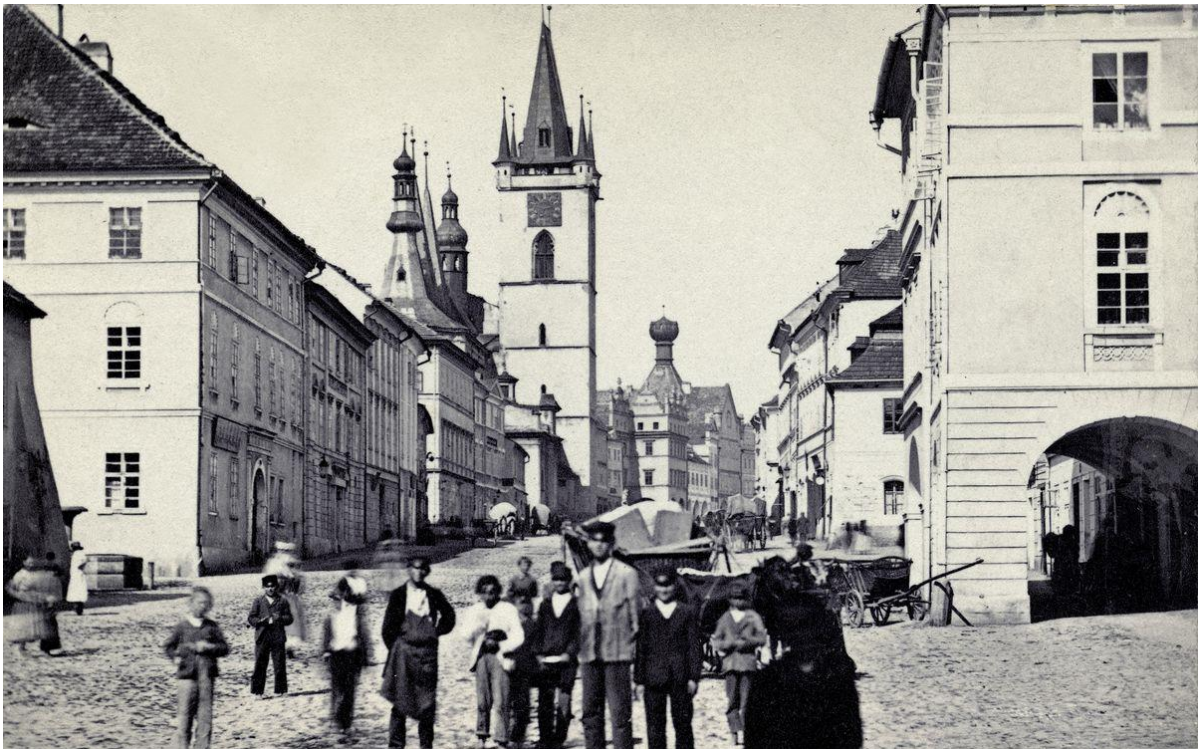
Dlouhá ulice, kolem roku 1870. Horní část ulice zachycená s jejími tehdejšími obyvateli se dodnes příliš nezměnila. Spodní část Dlouhé ulice byla od druhé poloviny 50. let do roku 1961 částečně zbourána v souvislosti s budováním silničního obchvatu města a křižovatky Na Kocandě.