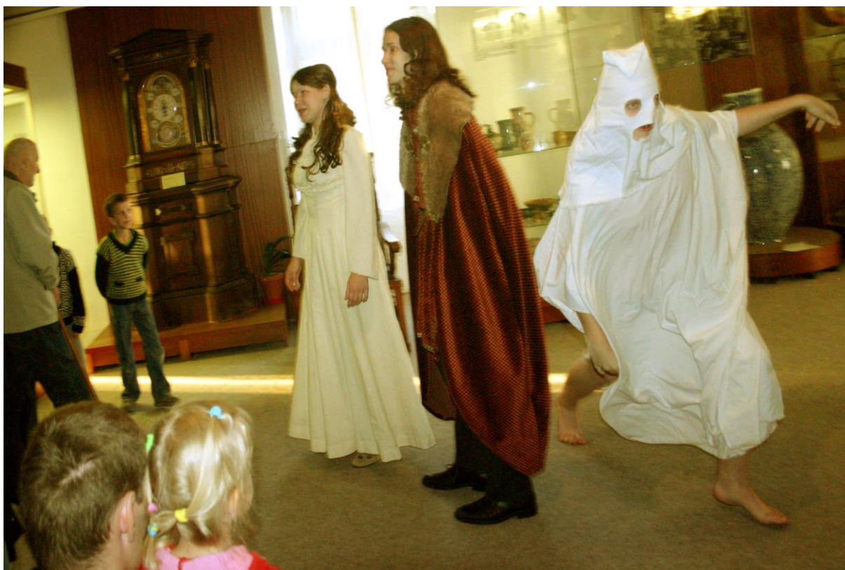
Na snímku: Karel IV. s Eliškou Pomořanskou. Kolem běží jeden z duchů nad Litoměřicemi.

Článek pro Věstník asociace muzeí a galerií: