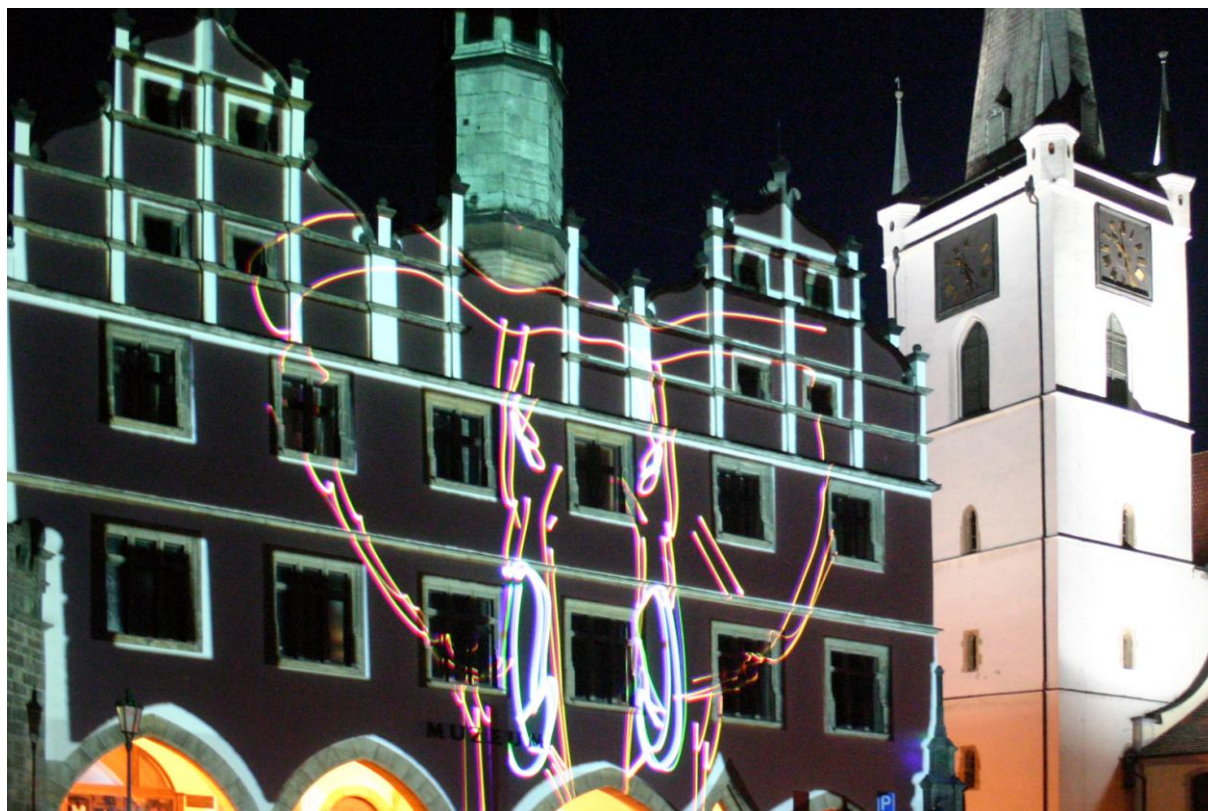
Na snímku: laser a video firmy QUIX čaruje na budově muzea.

Závěrem večera se stala monumentální projekce na budově muzea, která podtrhla architektonické prvky (okna a oblouky..) a zároveň připoměla významné momenty z historie této budovy i města Litoměřic. Důležitou roli zde sehráli video a laser. Na technicky mimořádně náročnou instalaci (kdy musela být vypnuta část veřejného osvětlení na Mírovém náměstí) se podařilo získat firmu QUIX ( www.quix.cz ). Tato firma má již mnohaleté zkušenosti z různých projektů – viz web)