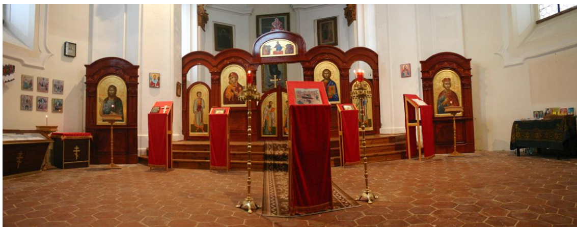
Nový ikonostas v chrámu sv. Václava na Novém Městě v Litoměřicích.

Vzácný host odjel zpět do vlasti 30. ledna. A moc se těší na další návštěvu. A mi také.